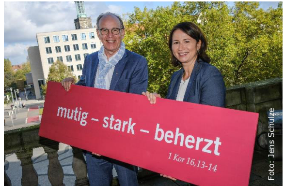
Landesbischof Ralf Meister und Präsidentin Anja Siegesmund mit der Losung des Kirchentages 2025

1949 wurde der Kirchentag in Hannover gegründet. Nach 1949, 1967, 1983 und 2005 kehrt er vom 30. April bis 4. Mai 2025 bereits zum fünften Mal zurück in die niedersächsische Landeshauptstadt – mit vielen tausend Besuchenden, fünf Tagen Musik- und Kulturveranstaltungen, Podiumsdiskussionen, Workshops und vieles mehr an Programm. Und vielleicht ja auch mit Ihnen und Euch?